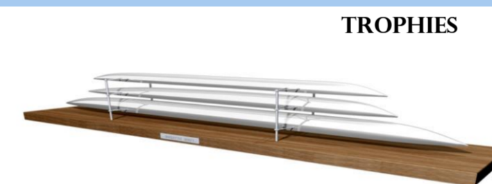
"125 JAAR SPORT GENT"