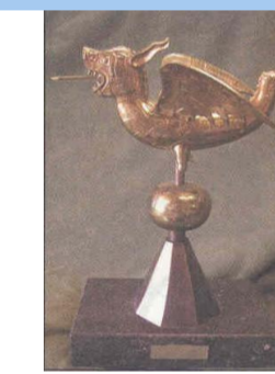
"CITY OF GHENT"